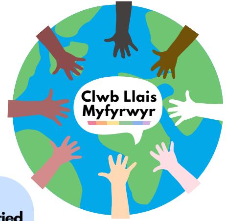
Y logo a'r enw sydd wedi'u cyddylunio!

Yn ein cylchlythyr diwethaf, gwnaethom rannu ein bod wedi dechrau panel iuenctid peilot yn Ysgol Gyfun Radur. Heddiw, hoffem gyflwyno'r enw y mae ein pobl ifanc wedi'i ddewis sef 'CLWB LLAIS MYFYRWYR'. Pam wnaethon nhw ddewis hwn? 'Myfyrwyr' oherwydd ei fod yn eu diffinio yn ôl rôl ac nid yn ôl oedran. 'Llais' achos mae pob llais yn bwysig a 'Clwb' achos mae croeso i bawb ac mae clybiau yn hwyl.