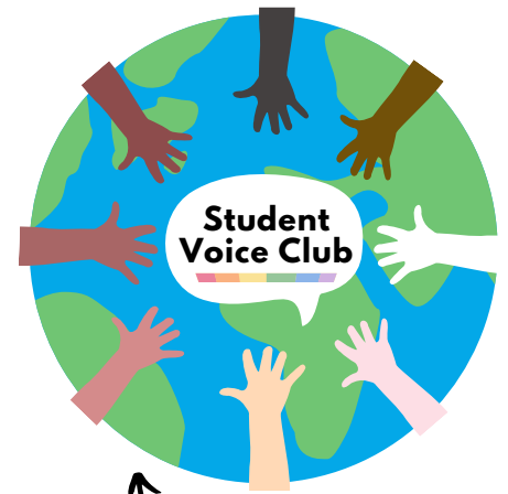
The co-designed logo and name!

In our last newsletter, we shared that we have started a pilot youth panel at Radyr Comprehensive. Today, we would like to introduce to you the name our young people have chosen ' STUDENT VOICE CLUB '. Why have they chosen this? 'Students' because it defines them by role and not by age. 'Voice' because all voices matter and 'Club' because everyone's welcome and clubs are fun.